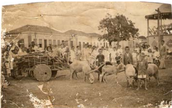
Praça da Matriz na década de 1920.

Ao dirigir-se ao “quarto”, o casal, à meia voz, com certo acanhamento, pede um pinico. Difícil atender, pois todos os urinóis da pensão já estavam disponibilizados para os demais quartos, incluindo o estoque